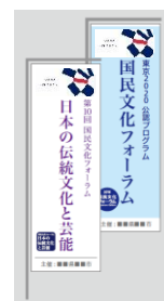
のぼり旗や横断幕に