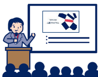
講演やステージの演出に